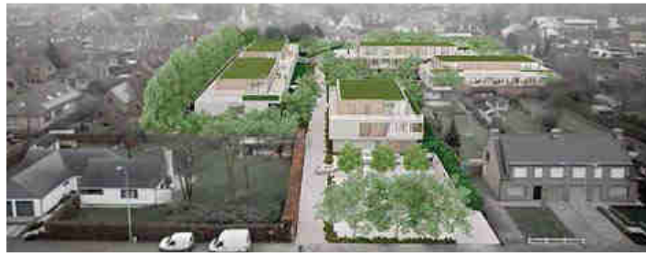
De huidige vestiging van Romel ruimt plaats voor woonpark Ter Beurse

Na de verhuizing eind februari naar Gullegem beginnen we in Izegem met de afbraak. De realisatie van woonpark 'Ter Beurse' zal, afhankelijk van de verkoop, ongeveer drie jaar in beslag nemen."