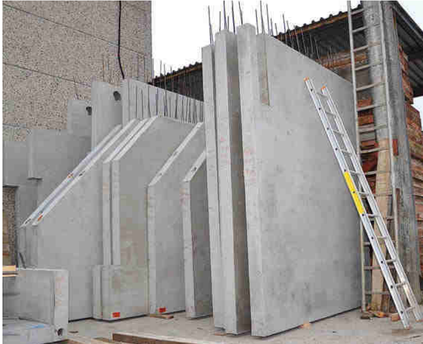
In de prefabafdeling worden er onder andere balken, kolommen, wanden en trappen gemaakt