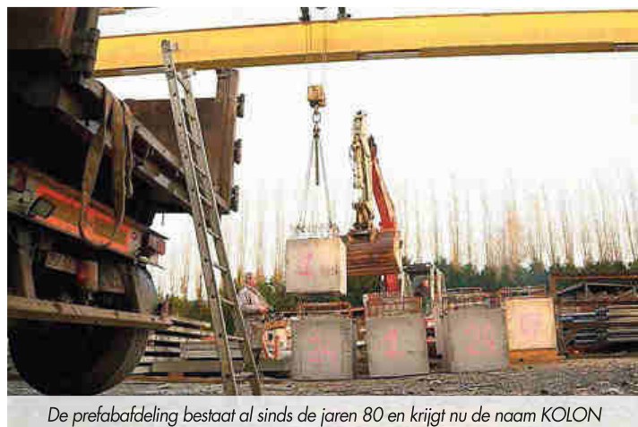
De prefabafdeling bestaat al sinds de jaren 80 en krijgt nu de naam KOLON