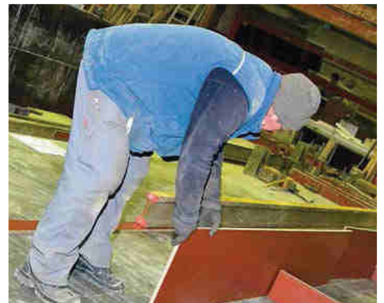
Bekister aan het werk in de prefabafdeling