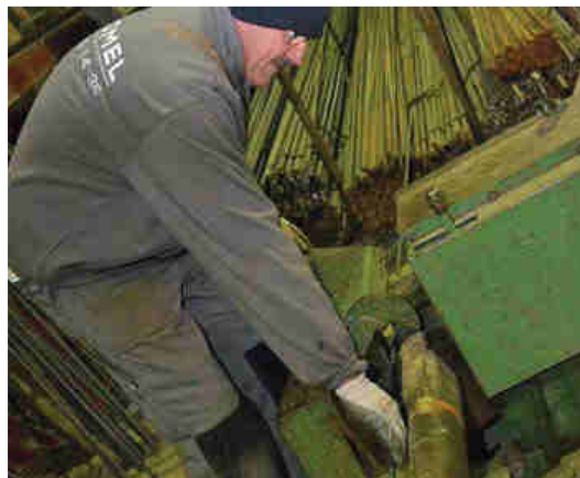
Uzervlechter aan het werk in de prefabafdeling